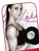
ZELENIJ LINDA ZONE