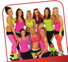
SIFI & KANGOO TEAM

Nosztalgiazz Sifivel és Kangoo csapatával április 6-án nagyszínpadi órájukon, ahol előkerülnek a régi nagy retró slágerrek és a neonszínű ruhák! Élđ át a retro feelinget s ha van kedved, öltözz be velünk te is!